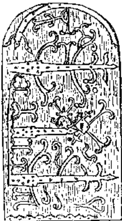
Dörren i sydportalen i Edsbergs kyrka